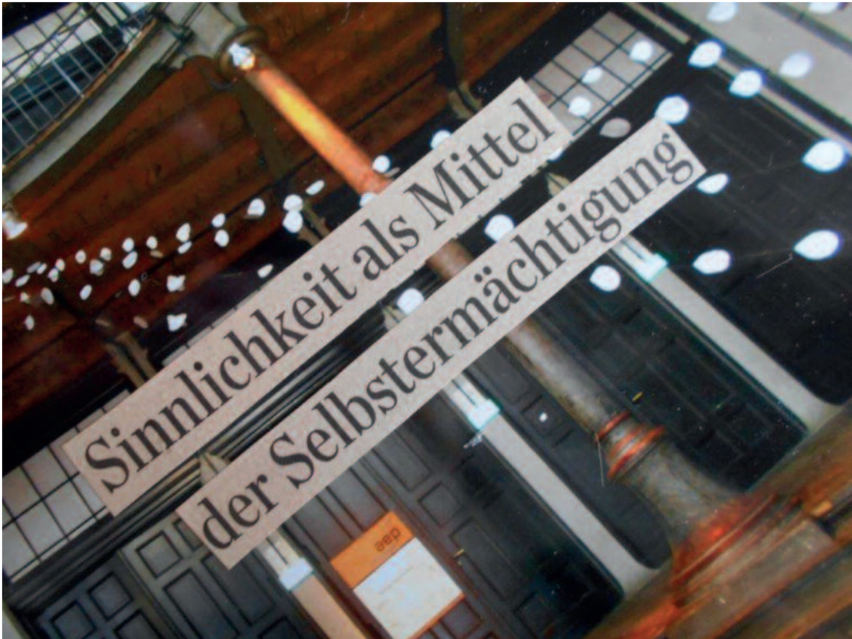
Fotonotiz von Brigitta Höpler